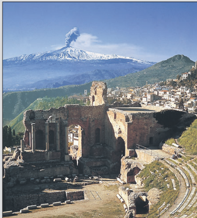
Griechisch-Römisches Theater von Taormina mit Blick auf den Ätna